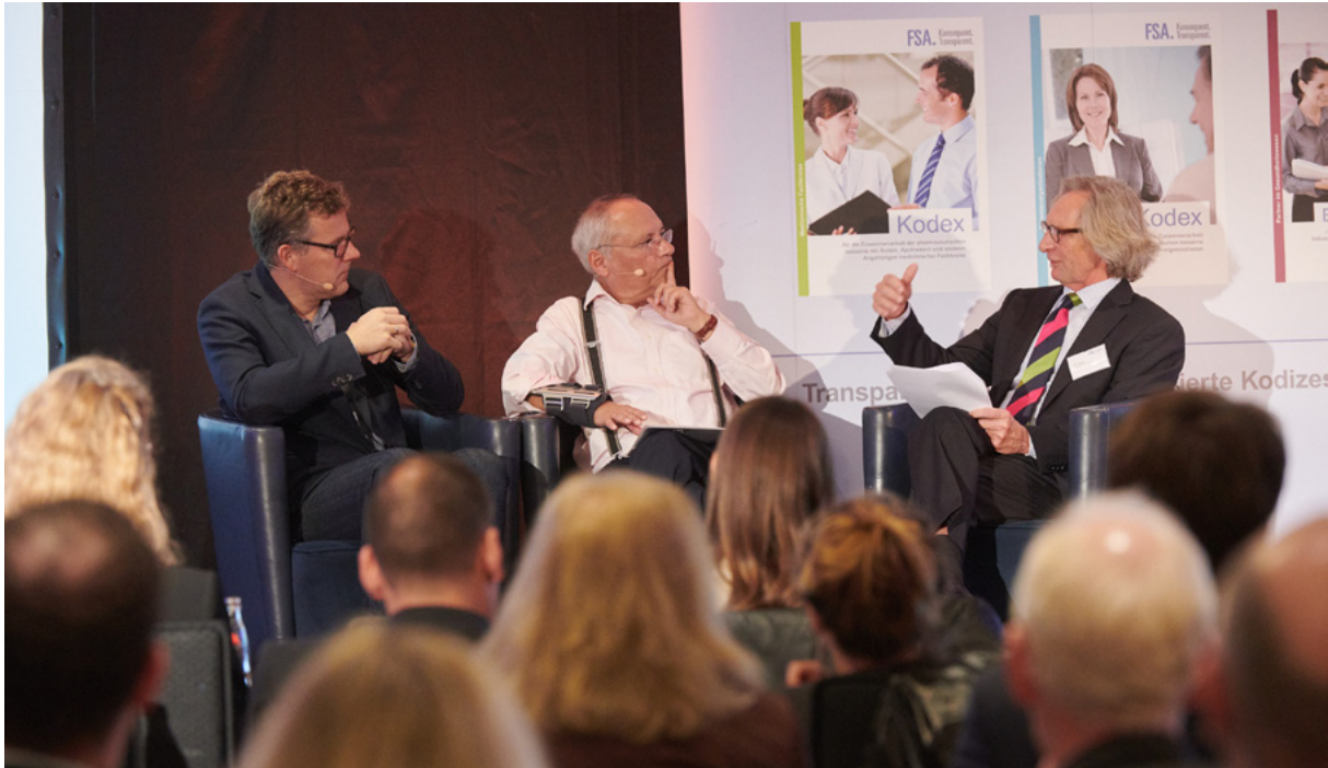
Die Diskutanten während der Podiumsdiskussion zum Thema „Vertrauen - was Transparenz leisten kann - und was nicht“